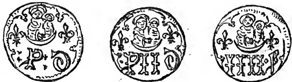
Les trois méreaux ci-dessus représentant les

A côté de ce commencement de première série, nous sommes heureux que les recherches et trouvailles que nous avons faites nous permettent de pouvoir en créer une autre; c'est ainsi que dans les trois pièces qui suivent, les chiffres sont d'un dessin tout autre que dans les deux qui précèdent, d'une facture plus élégante et plus rapprochée de nous. La lettre D, placée après le chiffre déterminant la valeur, offre également un dessin différent, ce qui, en somme, constitue une variété et par conséquent une seconde série.