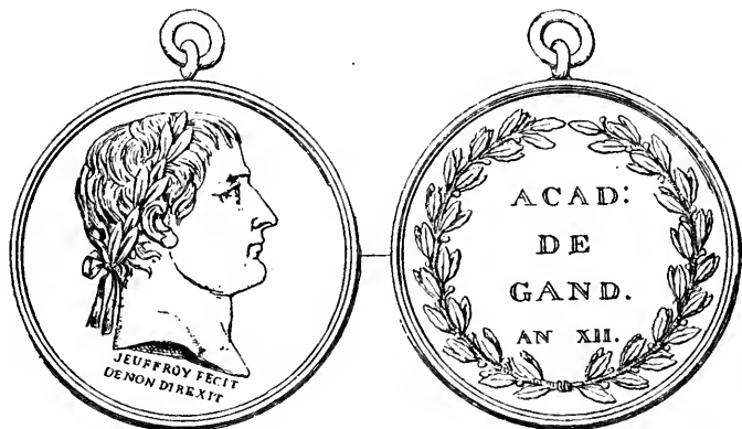
Poids : 33 gr .42.

La médaille ci-dessous fut ainsi créée en argent, sans que l'on indiquât à qui que ce soit le but auquel le coin primitif du droit avait été destiné :