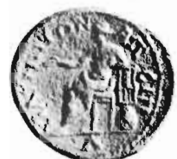
L'OMPHALOS, ATTRIBUT D'ASCLÉPIOS